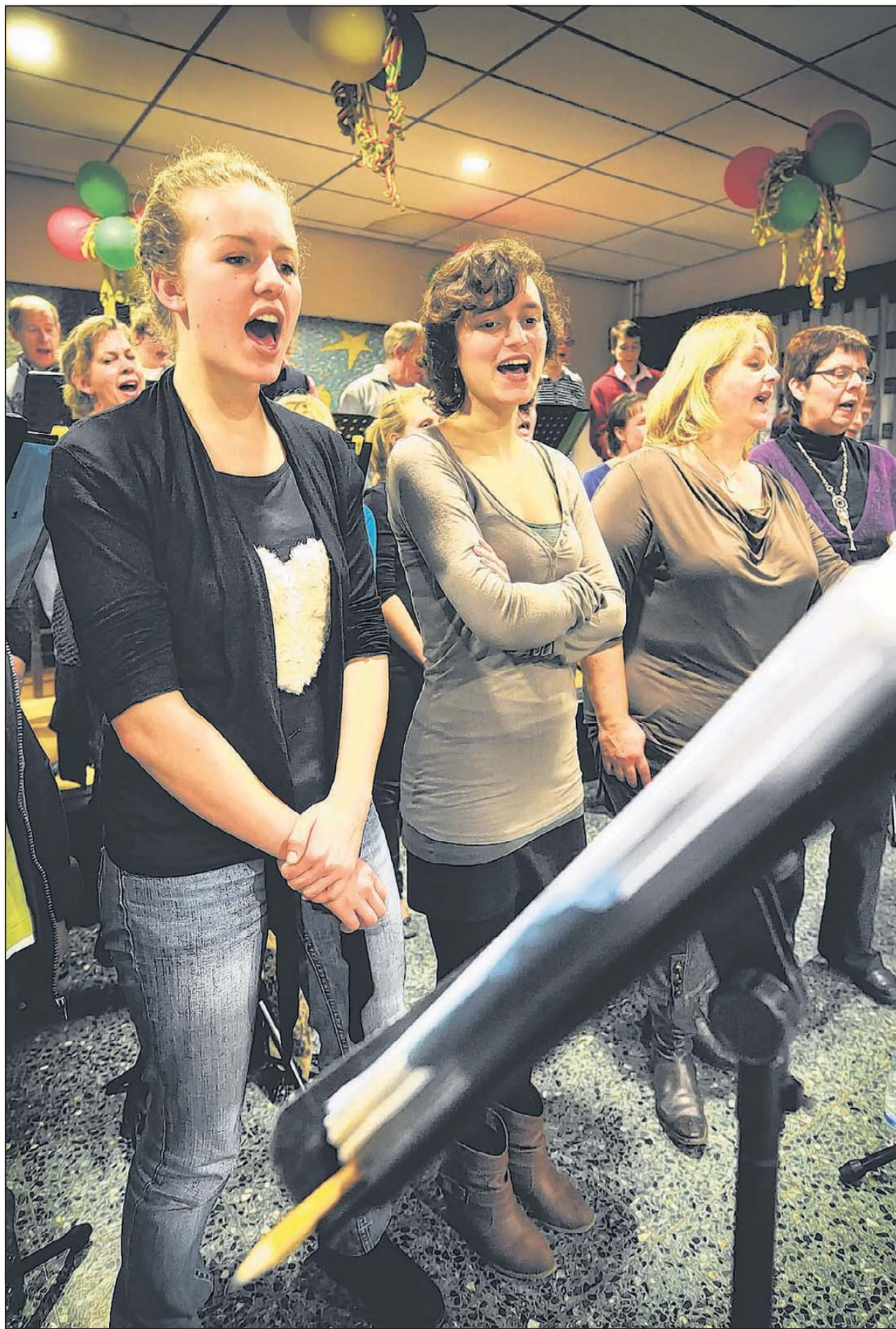
Thirdwing uit Heerlen groeit.